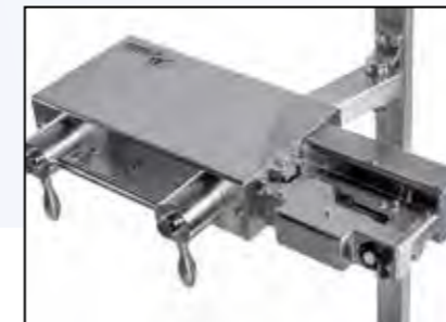
SafeSeal Pneumatik Tool