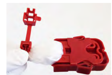
Manuelle Entriegelung des Kabelbinder-Verschlusses