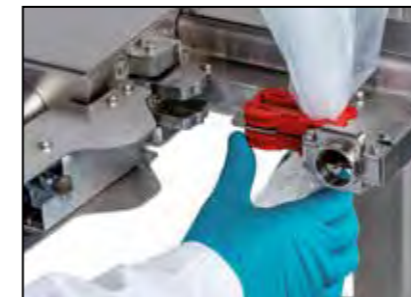
Einlegen SafeSeal Crimp