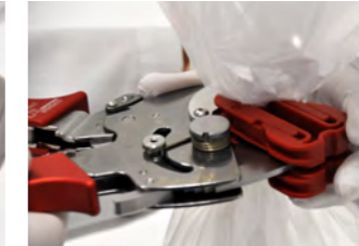
Durchschneiden / Trennen