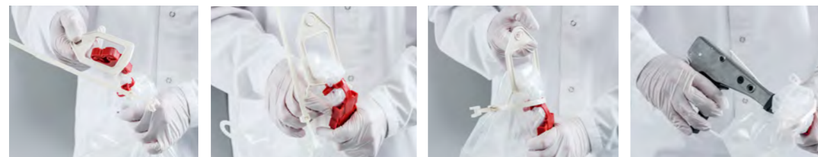
Aufhängetool überstülpen Folie abknicken Kabelbinder anlegen Kabelbinder festziehen