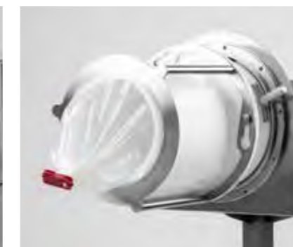
RTP Beta (CLCC)