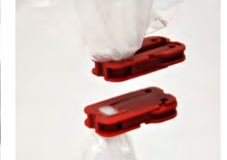
Beide Teile verschlossen