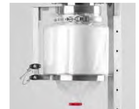
Continuous Liner System (CLS)