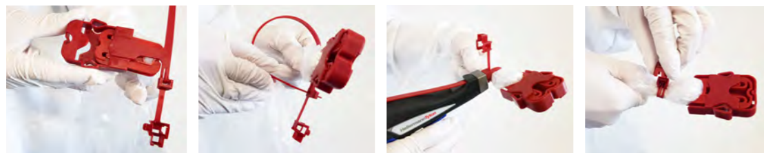
Schutzkappe aufstecken Kabelbinder anlegen Kabelbinder festziehen Schutzdeckel aufsetzen