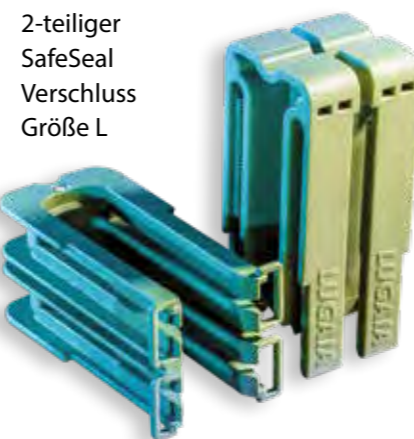
2-teiliger SafeSeal Verschluss Größe L