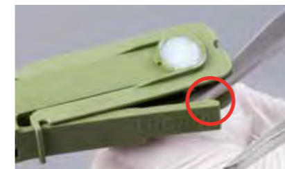
Aufbrechen des Sicherungsbügels auf beiden Seiten