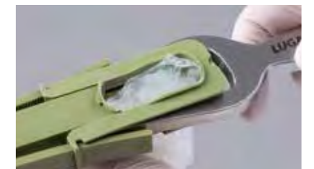
Crimp voneinander trennen