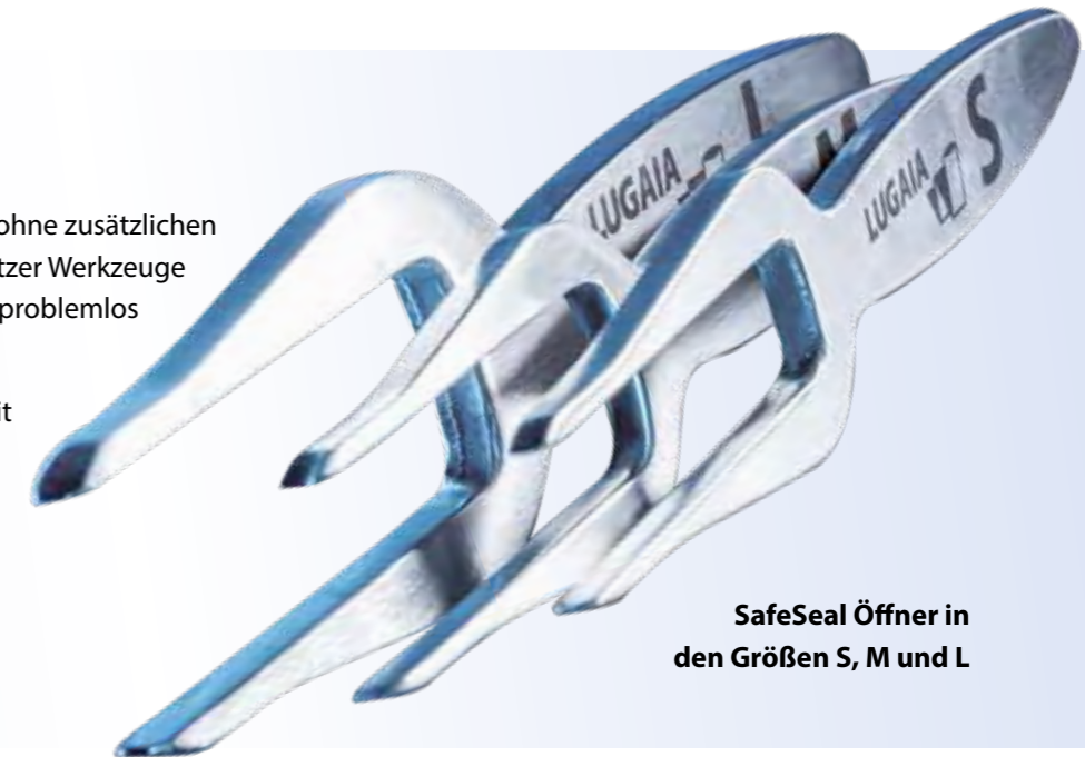
SafeSeal Öffner in den Größen S, M und L

QR-Code scannen und direkt das passende Video anschauen