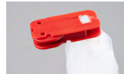
Lugaia SafeSeal Verschluss