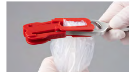
Crimp voneinander trennen