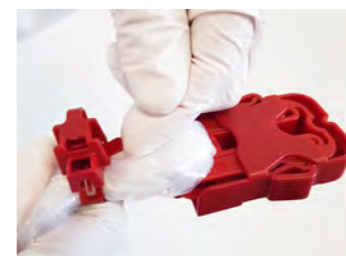
Öffnen des Schutzdeckels mittels Lasche