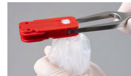
Öffner einstecken, der äußere Crimp öffnet sich